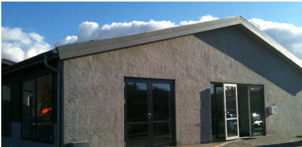
Skovlunde Frikirke, Metalbuen 42, 2750 Ballerup.